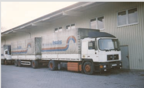
1996 - Übernahme der Firma ARS

Übernahme der Firma ARS, Niederfrohna (ehemals Samson in Warendorf)