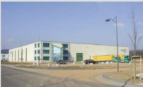
2002 - Neubau in Trier / Föhren

Inbetriebnahme einer neuerbauten Niederlassung in Trier / Föhren auf 3.600 m 2