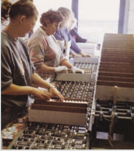
1988 - Erweiterung des Tätigkeitsbereiches