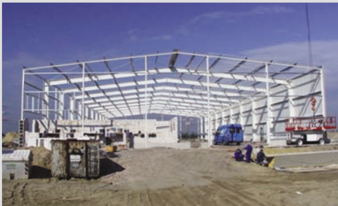
2000 - Neubau in Bremen