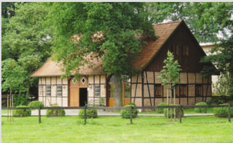
2004 - Die Aussenansicht unseres Bauernhauses