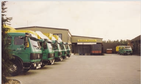
1987 - Standort Greffen an der Fritz-Reuter-Str.