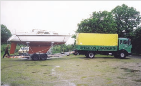
1982 - Transport einer Motorjacht