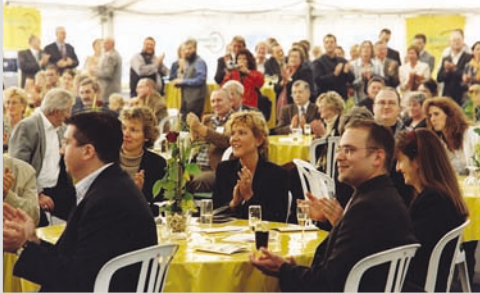
2004 - Unsere Gäste im großen Festzelt