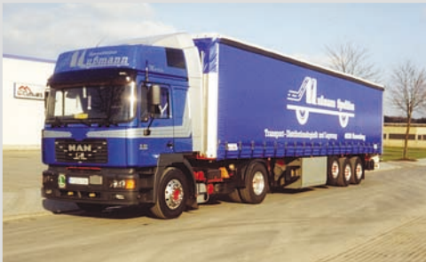
2005 - Fuhrpark der Fa. Mußmann