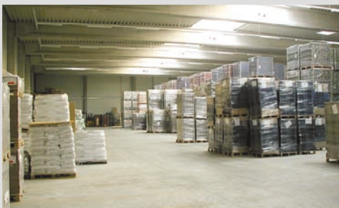
2002 - Lager- und Logistikhalle in Trier / Föhren