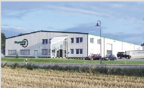
1997 - Inbetriebnahme in Gera

Bau der ersten Windkraftanlage in Beelen