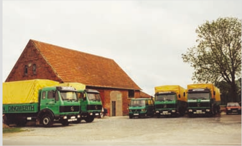
1983 - Standort Greffen an der Haller Straße

Bau einer Lagerhalle, eines Büros mit Sozialräumen und einer Rampenhalle