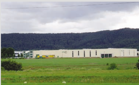
2007 - Kapazitätsausweitung in Trier/Föhren

Erweiterung des Standortes Trier/ Föhren Hallengröße von 3600 m 2 auf 7200 m 2 verdoppelt