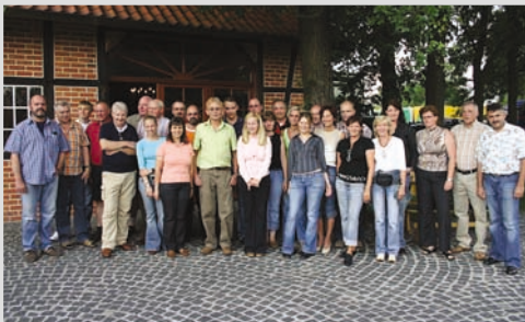
2006 - Unsere Kompetenz auf einem Blick