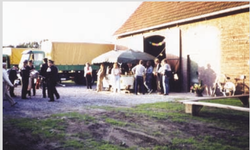
1984 - 5-jähriges Firmenjubiläum in Greffen