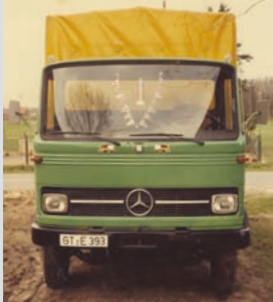
1980 - Der zweite LKW des Unternehmens