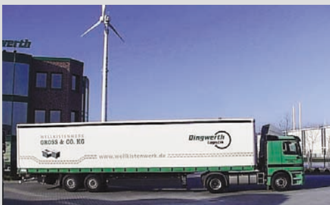
2001 - Einsatzfahrzeug für die Fa. Gross

Ablösung des LKW-Fuhrparks der Firma Gross Wellkistenwerk