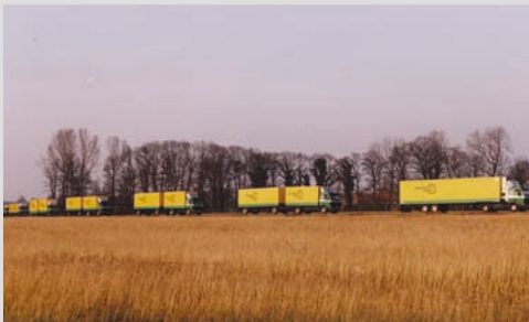
1993 - Umzug des Fuhrparks nach Beelen

Übernahme des Fuhrparks der Firma Brinkhaus Betten aus Warendorf