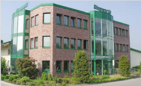
2000 - Neues Verwaltungsgebäude in Beelen