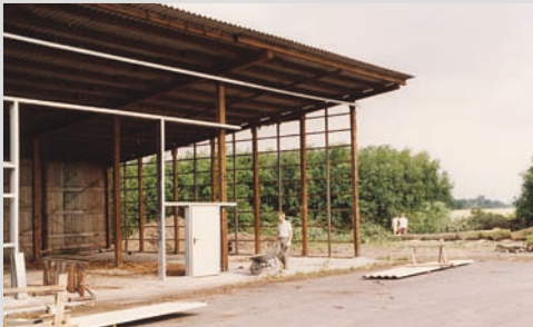
1991 - Umbau eines Holzlagerschuppens

Weiterer Bau einer Halle mit Keller und Aufzug in Greffen