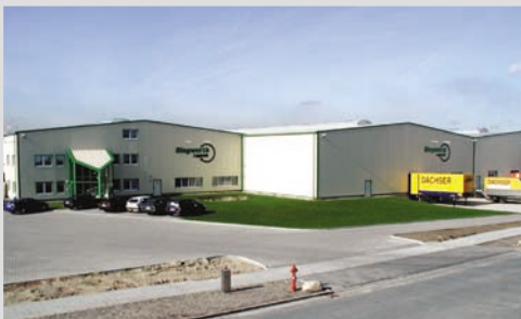
2003 - Erweiterung des Standorts Bremen

Einführung eines Roboters in Beelen für die Sortimenterstellung