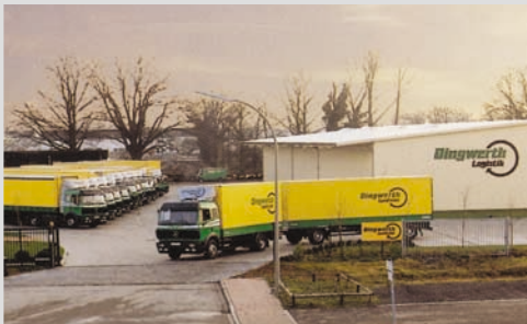
1994 - Standort Beelen

Hallenerweiterung in Beelen auf 5000 m 2