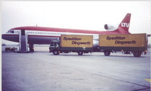
1985 - Anlieferung am Düsseldorfer Flughafen