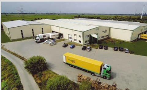
2006 - Bauphase in Bremen beendet

Letzter Bauabschnitt in Bremen abgeschlossen