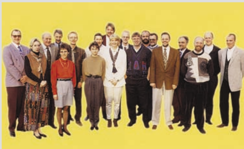
1994 - Die Belegschaft wächst...

Die Belegschaft ist auf 25 Personen herangewachsen