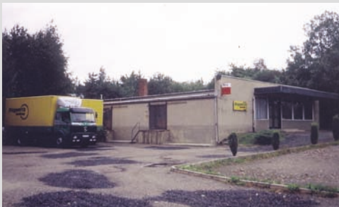
1992 - Eröffnung der Niederlassung Niederfrohna

Umbau des vorhandenen Holzlagerschuppen in Beelen in eine Distributionshalle (1.200 m 2 )