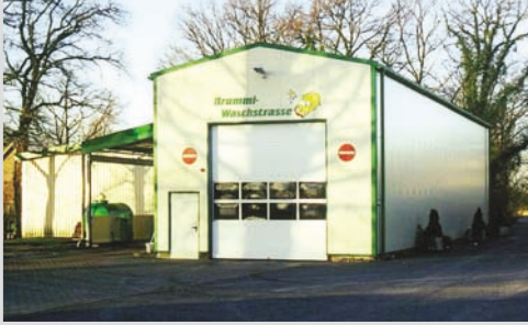
1999 - Bau einer ökologischen LKW-Waschanlage