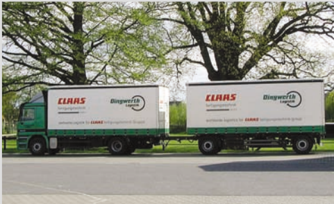
2000 - Einsatzfahrzeug für Claas Fertigungstechnik