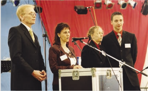
2004 - Familie Dingwerth bei der Begrüßung