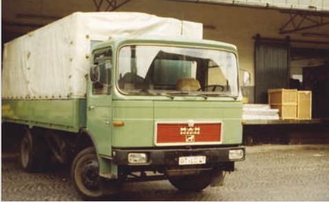
1979 - Der erste LKW des Unternehmens