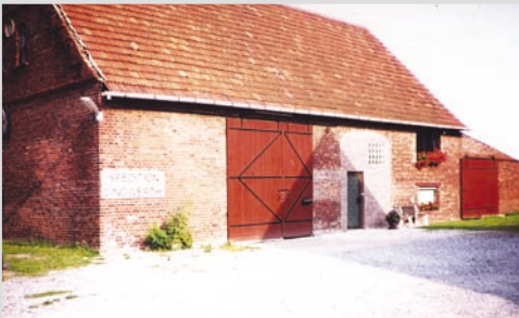
1980 - Standort Greffen an der Haller Straße